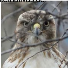
Halcón de cola roja fotografiado durante estudio aviar

A la fecha, el equipo del proyecto ha reunido gran cantidad de datos, más allá de lo que normalmente se hace en apoyo a un análisis de la NEPA. El equipo usó alrededor de 2,900 horas para recopilar datos en el campo, e identificó más de 300 especies de plantas y más de 120 especies de aves en Área del Proyecto. También existen estudios en curso sobre mamíferos, reptiles, anfibios, peces e invertebrados bentónicos. Además de los estudios sobre las especies, el equipo evalúa la calidad de los actuales hábitats en los humedales. A fines de agosto de 2017, el equipo del proyecto contará con un año completo de datos ecológicos. A partir de los datos ecológicos recopilados a la fecha, el equipo del proyecto analiza métodos para proveer