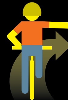
VUELTA OPCIONAL A LA DERECHA