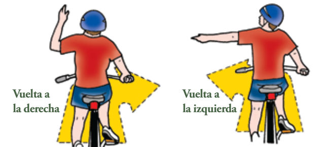
Vuelta a la derecha