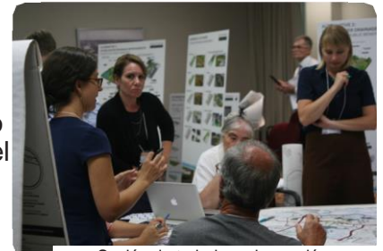
Sesión de trabajo en la reunión en septiembre del CAG.

A medida que se materializan los conceptos del diseño del Proyecto Rebuild by Design de Protección contra Inundaciones del Meadowlands (RBDM), la reunión del Grupo de Asesoramiento Ciudadano (CAG, por sus siglas en inglés), en septiembre, se centró en involucrar a los miembros del CAG en discusiones sobre cómo los distintos conceptos podrían ser mejor implementados en el área del proyecto. Celebrada el 20 de septiembre de 2016, en la Sala de Conferencias del Port Authority en el aeropuerto de Teterboro, la reunión comenzó con el discurso de apertura y el estatus actual de la propuesta por el equipo del proyecto del Departamento de Protección Ambiental de Nueva Jersey.