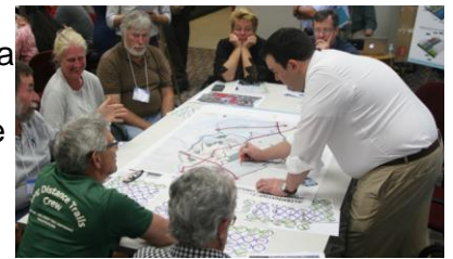
Diseño de conceptos potenciales del proyecto en la reunión en septiembre del CAG

Luego, se presentó a los miembros del CAG las opciones de diseño conceptual, las cuales introdujeron los posibles componentes de cada una de las tres actuales alternativas de diseño: Reducción estructural de las inundaciones, Mejoras en el drenaje de aguas pluviales, y la Alternativa híbrida. Para la alternativa de Reducción estructural de las inundaciones, los componentes variaron desde un muro de encauzamiento básico con tablaestacas hasta diseños más elaborados de un banco de retención, dosel y anfiteatro. Los conceptos para Mejoras en el drenaje de aguas pluviales variaron desde conceptos de un espacio abierto simple hasta diseños para la creación o mejora de los humedales, jardines de lluvia y vía para bicicletas con pavimento permeable. Los conceptos de la Alternativa híbrida son una combinación de estos elementos estructurales y drenaje de agua pluvial, tomados y mezclados con los componentes de cada una de las otras dos alternativas. La lista de los conceptos del proyecto, discutidos en la reunión, y el paquete de la reunión, están en el sitio web de RBDM: www.rbd-meadowlands.nj.gov