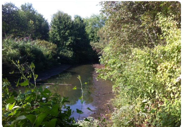
Losen Slote (también llamado Eckles Creek) en Little Ferry, sistema de drenaje crítico en el área del proyecto

Estos datos servirán para generar volúmenes de tráfico existentes, determinar la hora pico en cada período pico analizado, y hacer un análisis del tráfico de las condiciones existentes para determinar el volumen de uso de cada sitio estudiado. Con este análisis de base se evaluarán los impactos potenciales del tráfico en la construcción y operación del proyecto propuesto.