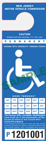
FIGURA 2: Cartel de persona con discapacidad permanente