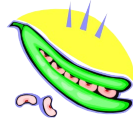
हरी सब्जियां आदि (ग्रीन्स) सूखे बीन्स