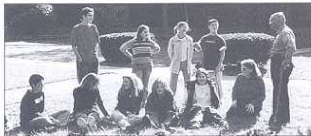
Miembros del grupo Estudiantes en contra de Decisiones Destructivas (SAADD, siglas en inglés) se reúnen con frecuencia en todo el estado para dialogar sobre las formas de combatir el manejar en estado de ebriedad entre los menores de edad

Si al individuo se le encuentra con una concentración de alcohol en la sangre (BAC) de .10 o mayor, se le someterá: